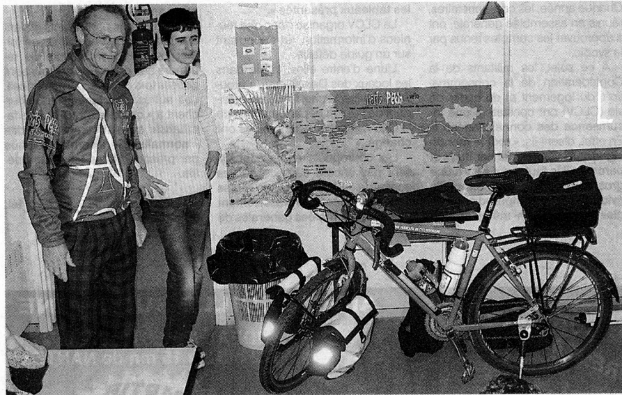
Ultimes présentations à l'école Marcel-Gouzil.

Et c'est un peu de celle-ci qu'ils emmèneront et ramèneront sur leur vélo de 20 kg, avec un langage